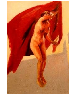
Günter Evertz Wendebild Galerie Lampedusa Seelingstr. 57