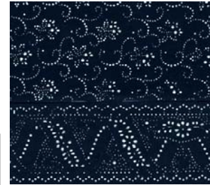
Elke Weiss Blaudruck Knobelsdorffstr. 15