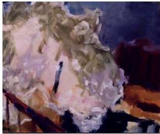
Norbert Quies „Vier Jahreszeiten“ alluttirps Danckelmannstr. 20