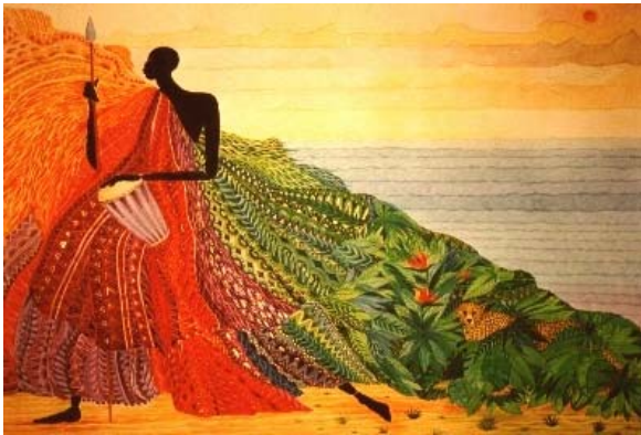
Berit Engels , ww-medien, Knobelsdorffstr.23