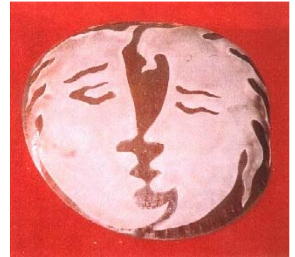
Olça Tansuk Sirkeoğlu