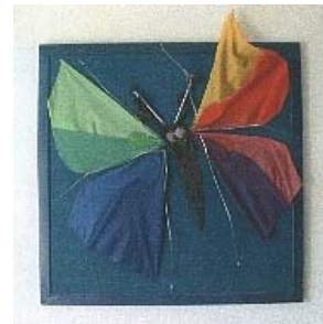
Elke Betzner Regenfalter, Collagen Verein alleinerziehender. Mütter und Väter, Seelingstr. 13