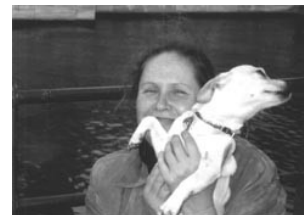
Christine Janssen „Hunds-Freunde“ Fotografien Augenoptik b.maske u. g.maske Schloßstr.60