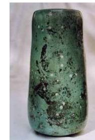
Michael Stürenburg Keramik s. a. Programm