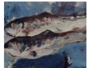
Ortrud Gerhard Optik G. Bründgens Klausenerplatz 23