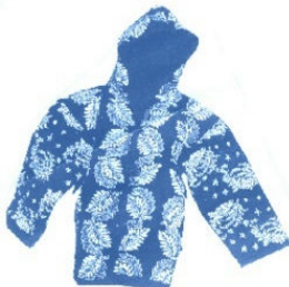
Elke Weiss Blaudruck Knobelsdorffstr.15