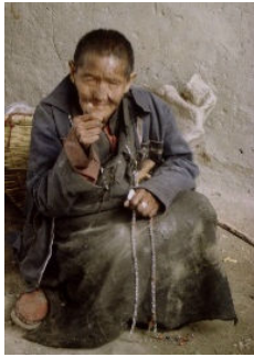
Jutta Bielfeldt „Menschen in Süd-Ost Asien“ Galerie Lampedusa Seelingstr.57 s. a. Programm