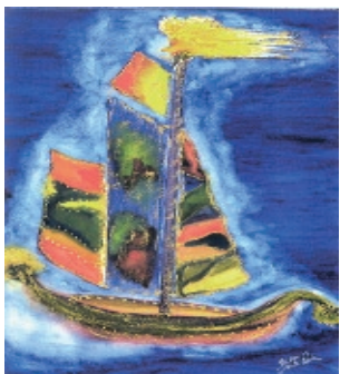
Gisela Pötter Falken Apotheke Seelingstr.39