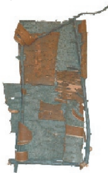
Elke Betzner Collagen VAMV, Seelingstr.13