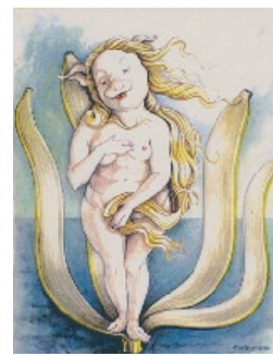
Elke - saugut drauf Nicolaisen's Schweine- karikaturen Kiezfahrräder, Nehringstr.5