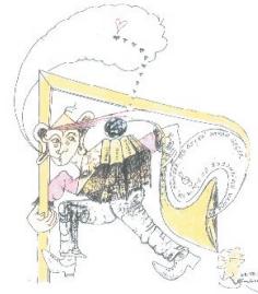
Gengiz Gömüsay Vier Bücher und die Welt Taverna Karagiosis, Klausenerplatz 4